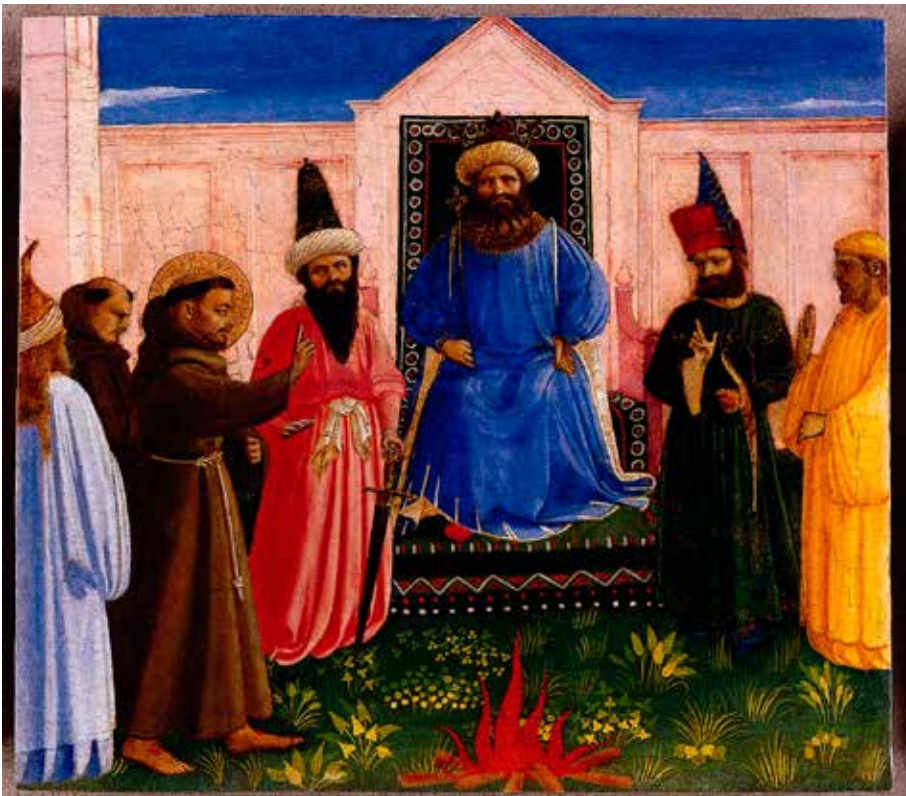
Fra Angelico, Franciscus voor de sultan , 1428-1429. Lindenau, Museum Altenburg.

Het werk op de tentoonstelling dat op mij persoonlijk veel indruk maakte was een bruikleen uit het Lindenau-Museum in Altenburg. Het ging om een indrukwekkend werk van de dominicaanse schilder Fra Angelico: Vuurproef van Franciscus voor de Sultan (1429).