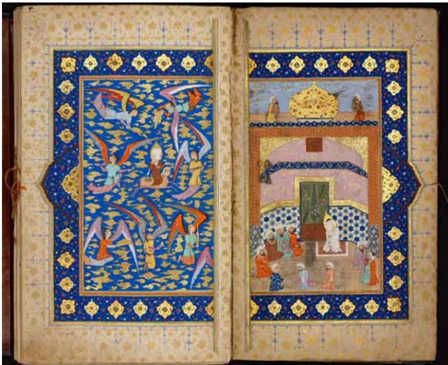
'Qisas al-anbiya' ( Verhalen over de profeten ), Shiraz, Iran, 1577. Berlijn, Staatsbibliothek zu Berlin - Preußischer Kulturbesitz, Orientabteilung, Ms. Diez A fol. 3.

Museum Catharijneconvent is het rijksmuseum voor christelijke kunst en belicht – in samenspraak met partners en publiek – de esthetische, culturele en historische waarden van het christelijk erfgoed, met het doel meer inzicht te krijgen in onze huidige leefwereld. Vanuit deze kern – vanuit de nationale collectie op het gebied van christelijke kunst, vanuit onze eigen identiteit – verhouden wij ons zelfbewust tot andere religies. We zijn in 2016 een nieuwe tentoonstellingsreeks gestart. Waar we eerder alleen zijdelings aandacht gaven aan andere religies – door bijvoorbeeld bij tentoonstellingen over caritas of pelgrimeren het publiek in de eerste zaal uit te leggen dat deze thema's geen christelijke uitvindingen zijn -, maken we nu eens in de twee jaar tentoonstellingen met gelijke aandacht voor het erfgoed van het christendom en van andere wereldgodsdiensten. Deze verandering heeft uiteraard te maken met de gewijzigde samenstelling van