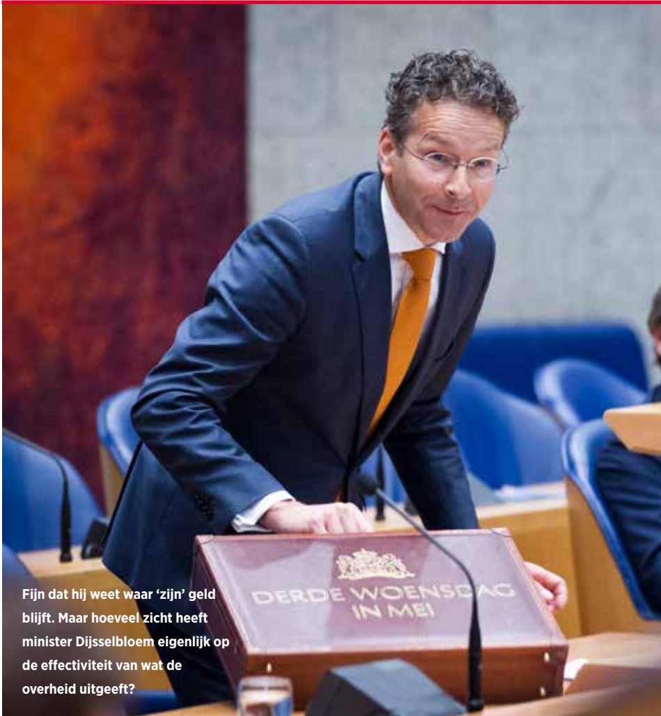
Fijn dat hij weet waar 'zijn' geld blijft. Maar hoeveel zicht heeft minister Dijsselbloem eigenlijk op de effectiviteit van wat de overheid uitgeeft?

Ook opvallend is dat het kabinet zich op de borst slaat over de rechtmatigheid van de uitgaven, verplichtingen en ontvangsten. Deze lag ook over 2015 ruim boven de norm van 99 procent. Het is natuurlijk geruststellend dat de overheid weet waar het geld blijft dat ze binnen krijgt, maar dit nog niet zoveel over de effectiviteit van de bestedingen. Rekenkamervoorzitter Arno Visser geeft in deze Forum het voorbeeld van de regelingen om werkloze ouderen weer aan een baan te helpen. Volgens Visser zijn er acht regelingen, maar weten de minister noch de Kamer wat ze kosten en wat ze opleveren. 'Aan goede bedoelingen ontbreekt het niemand, maar die leiden niet automatisch tot goede resultaten. Je moet weten of er politieke keuzes worden gemaakt die niet werken.' Wat dat betreft kan de overheid nog wel wat opsteken van ondernemers (zie kader). Ook om de groeiambities die het kabinet in 2014 had waar te maken. ■